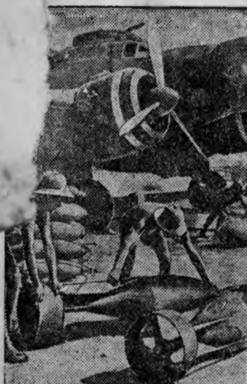
Погрузка бомб в самолет на аэродроме в одной из итальянских колоний.

производит допозднительный набор детей в детский сад в возрасте от 3 до 7 лет. Заявления подаются на имя заведующего детским садом.